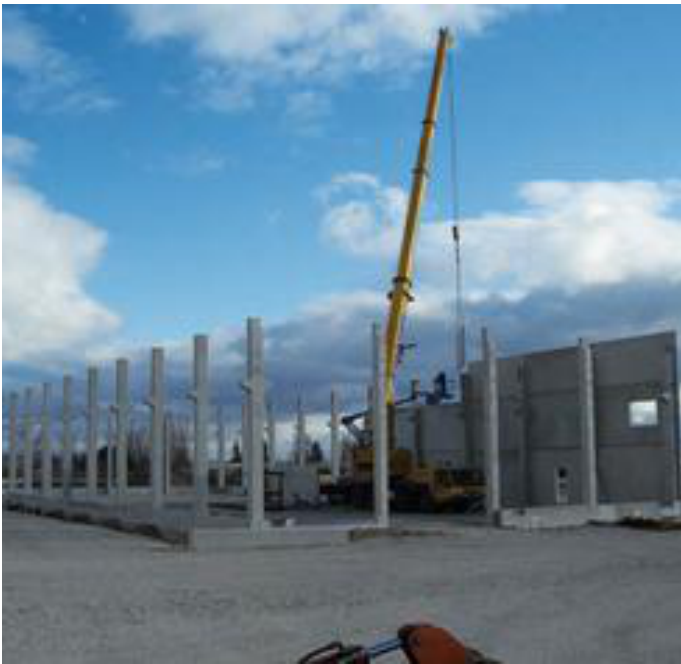
Stonbauteile aus dornburger zement