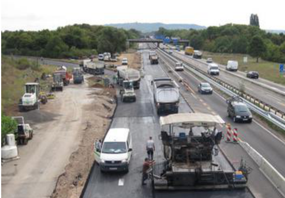
thomas straßenbau: A 61 „Speyer – Krefeld“