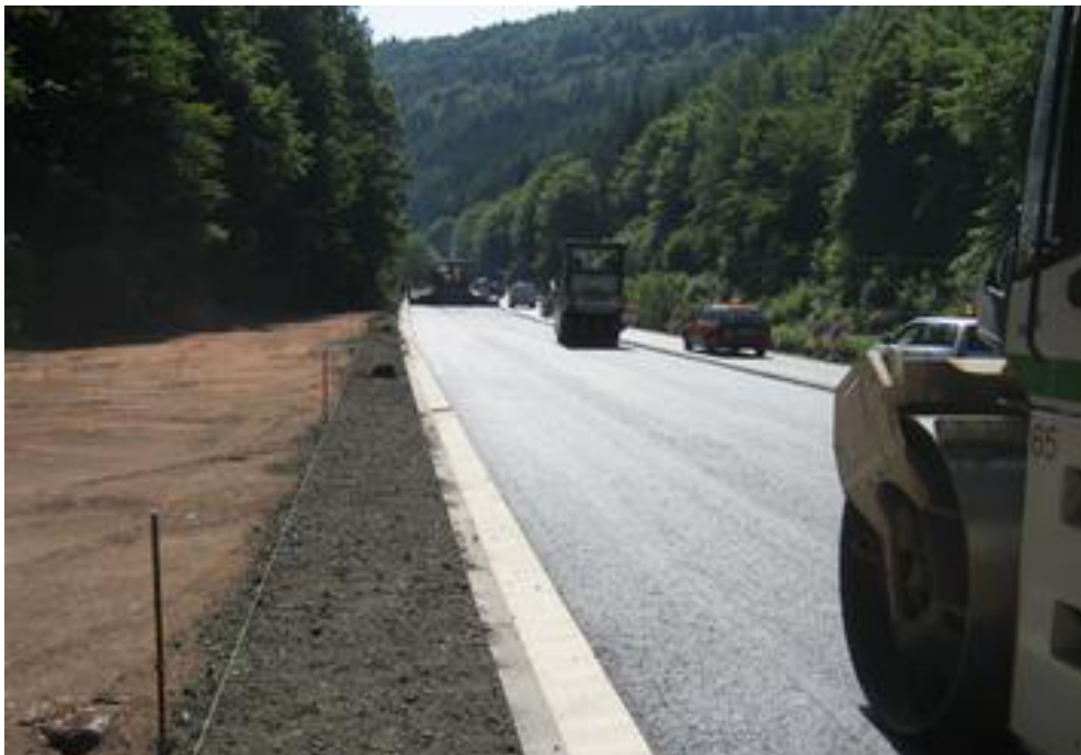
thomas straßenbau: B37