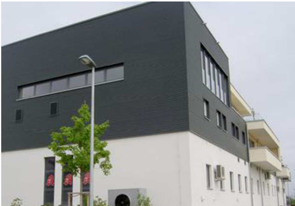
thomas betonbauteile: Wohn- und Geschäftsgebäude Taunusblick